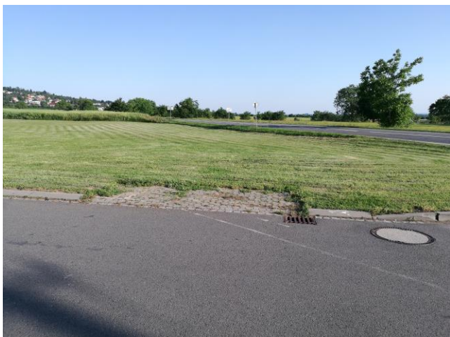
začátek chodníku,napojení na místní komunikace v obci