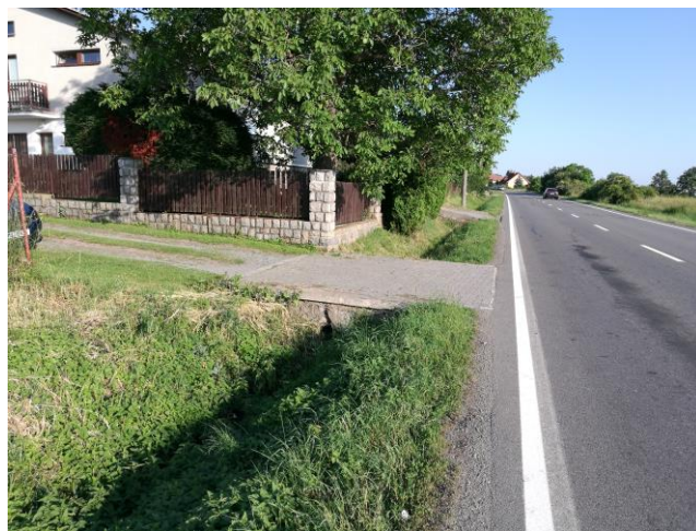
zúžený prostor – silniční příkop mezi vozovkou a oplocením zahradnictví nebo rodinného domu