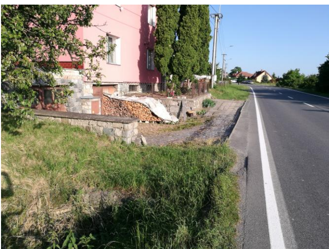
sjezd a chodník před domem na p.č. 424