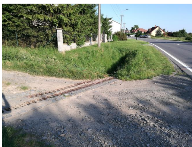
napojení polní cesty a plocha pro chodník kolem oplocení RD v Samotíškách