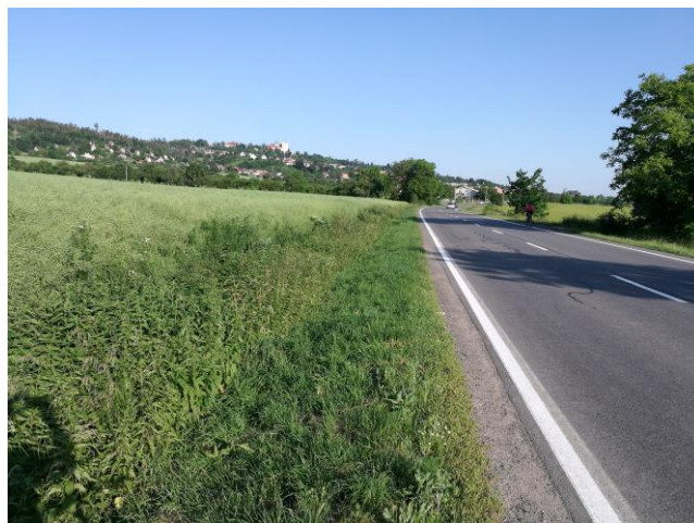
km 0,150 trasa podél pole – pozemek firmy Staving